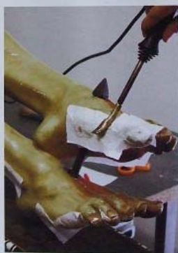
Proceso de sentado de color, fijación de los estratos pictóricos al soporte de madera.